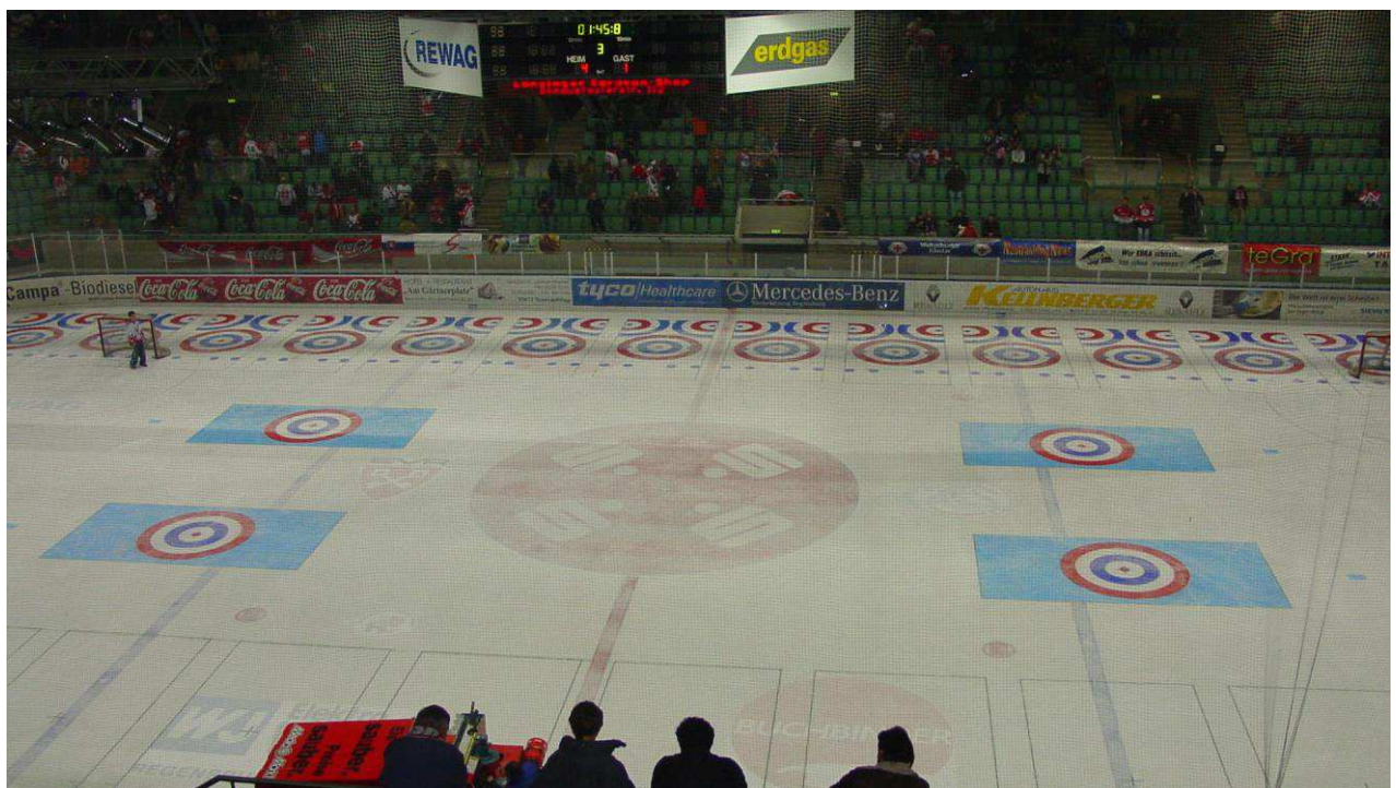
- farbige Zielfelder bei der EM in Regensburg -